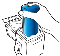
②消火剤アンプルを 取り出す